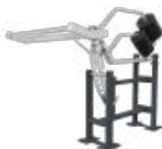
Squat Machine - Art. K08000