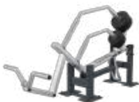
Biceps - Art. K08020