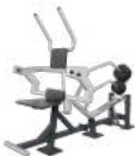
Abdominal Muscle - Art. K08023