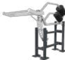
Squat Machine - Art. K08000