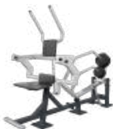
Abdominal Muscle - Art. K08023