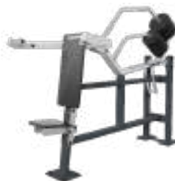
Shoulder Press - Art. K08005