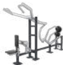
Lat Pulldown - Art. K08001