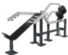
Incline Bench Press - Art. K08014

musculaire spécifique. La polyvalence de nos machines permet un entraînement efficace et équilibré de tous les principaux groupes musculaires.