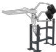
Squat Machine - Art. K08000