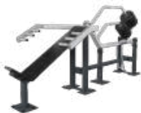
Incline Bench Press - Art. K08014

jambes, épaules et pectoraux), il permet un entraînement efficace et rapide. Idéal pour les espaces d'entraînement plus compacts ou en complément d'une offre existante.