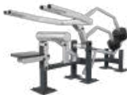
Triceps - Art. K08003