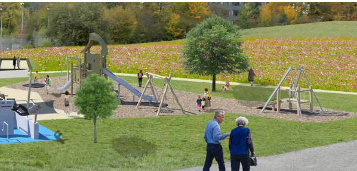
Illustration d'un parc intergénérationnel