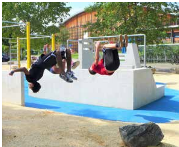
Triple Somersault dans la zone de parkour