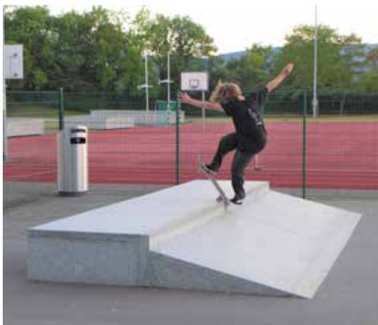
Skatepark en granite